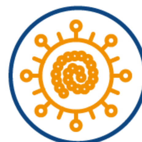
КІР, ПАРОТИТ, КРАСНУХА