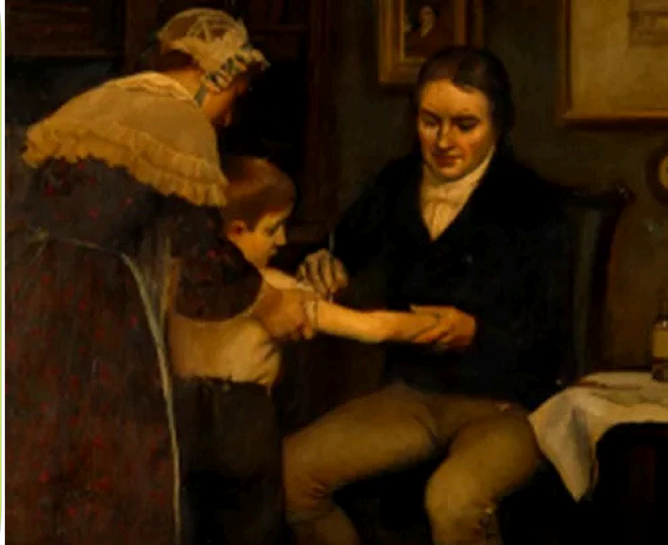
Перше щеплення від натуральної віспи (ілюстрація)

У 1796 році англійський лікар Едвард Дженнер зробив відкриття, яке розпочало еру вакцинації